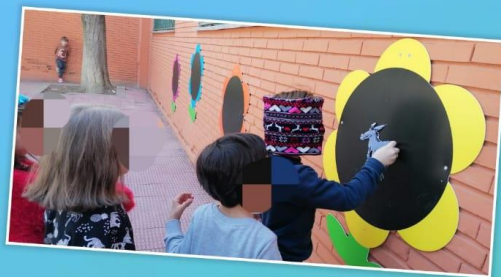
Juego poner el rabo al burro